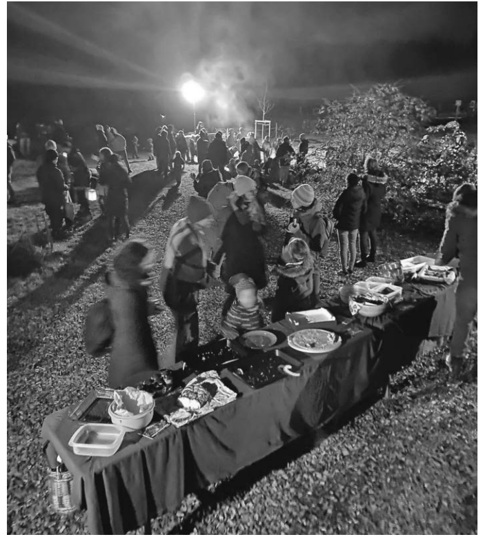
Teilervesper an St. Martin

Jetzt wünschen wir allen Bodnegger*innen ein friedvolles Weihnachtsfest und alles Gute für 2025.