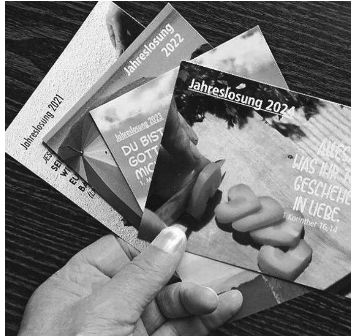
Manfred Bürkle, Jahreslosung