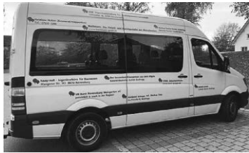
Bequem und komfortabel reisen mit dem Bodnegger Gemeindemobil