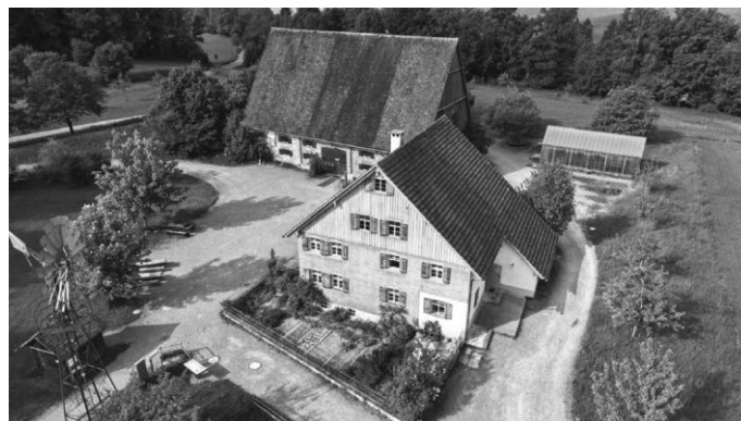
Blaserhof, Zehntscheuer