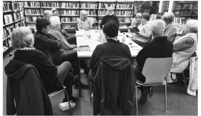
Informativ, interessant, zwanglos, angenehm und offen: Der monatliche Lesekreis der Bücherei

An jedem letzten Freitag im Monat werden in einem Kreis Interessierter neue bzw. empfehlenswerte Bücher vorgestellt, aus ihnen vorgelesen und darüber diskutiert. Leserinnen und Leser sind herzlich eingeladen, ihr Lieblingsbuch zu präsentieren bzw. einfach auch nur zuzuhören, um interessante Werke kennen zu lernen. Es muss kein Buch vorgestellt werden, kommen Sie doch einfach mal vorbei, wenn Sie Lust dazu haben.