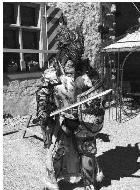
Crux der Drachenritter