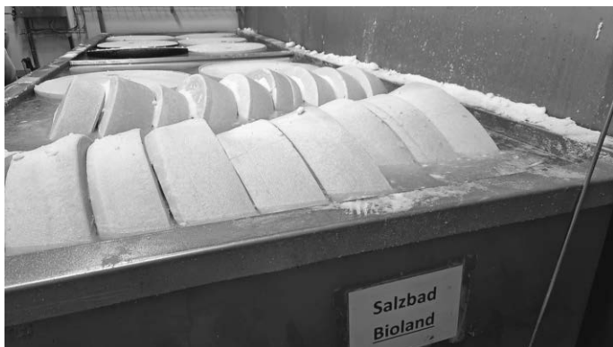
Salzung der Käslaibe