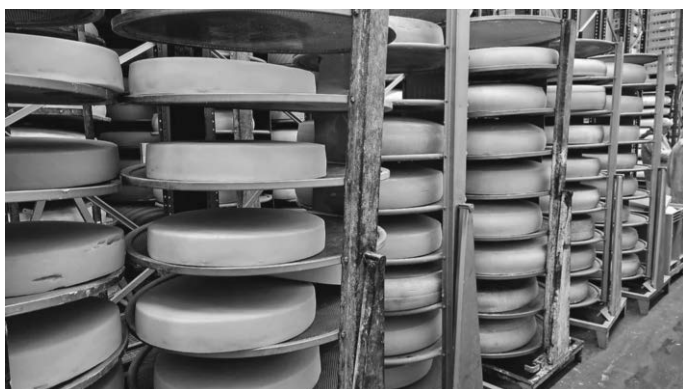
Reifung der Käslaibe