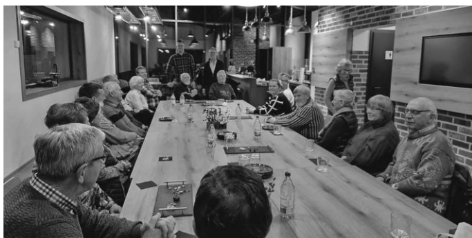
Ausklang im Showroom