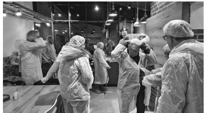
Anziehen der Hygienekleidung